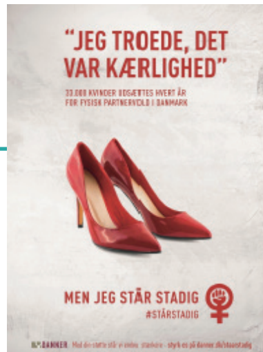
Organisationen Danners kampagner

( https://danner.dk/starstadig-alle-vegne )